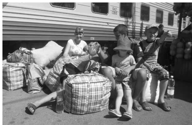
ВОТ ТАК И УЕЗЖАЛИ: ДЕТИ И НЕМНОГО ВЕЩЕЙ