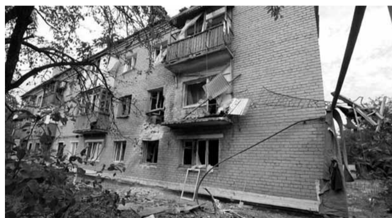
ВОТ И ТАКИЕ ДОМА ОСТАВИЛИ БЕЖЕНЦЫ