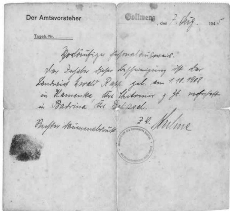
ПРОПУСК, ДЕЙСТВОВАВШИЙ НА ТЕРРИТОРИИ ГЕРМАНИИ В 1945 ГОДУ. ВМЕСТО ПОДПИСИ - ОТПЕЧАТОК ПАЛЬЦА

В МОРЯКОВКЕ ПРОЖИВАЕТ 46 СЕМЕЙ РЕПРЕССИРОВАННЫХ