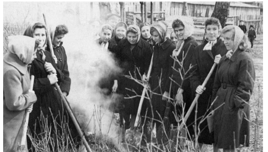
НА ШКОЛЬНОМ ДВОРЕ