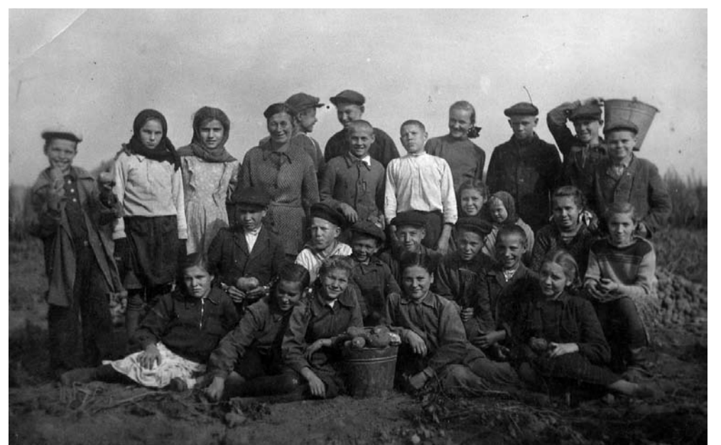
ШКОЛЬНИКИ НА СБОРЕ КОЛХОЗНОЙ КАРТОШКИ