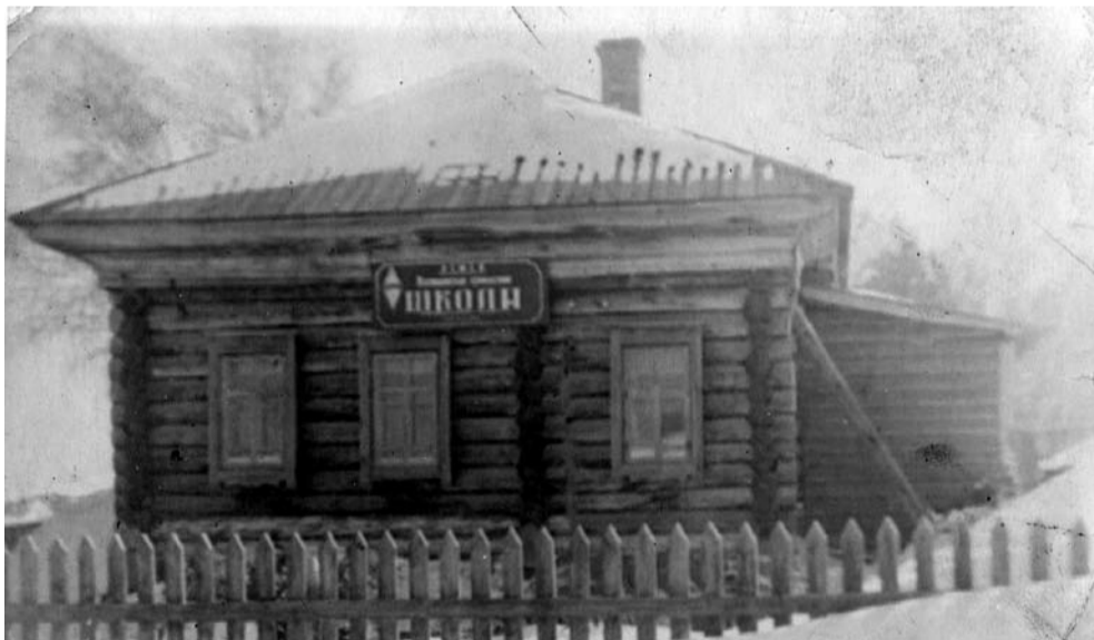
ТАКОЙ БЫЛА КОЗЮЛИНСКАЯ ШКОЛА