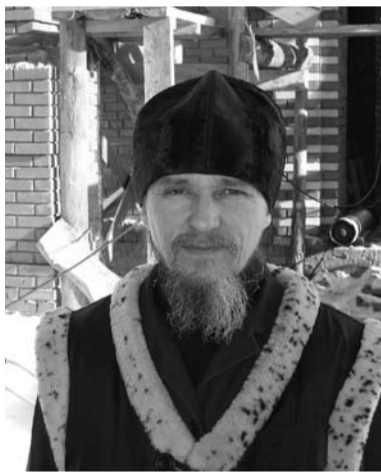
22 ноября 2010 года состоялась установка креста на купол храма Покрова Пресвятой Бого-